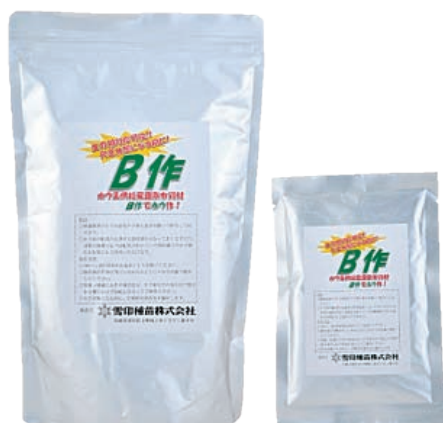
写真1 ホウ素供給専用肥料「B作」

ホウ素供給専用肥料「B作」はその対象が極めて狭いにも関わらず、発売以来各方面でご活用いただいております（写真1）。昨年10月、北海道発明協会よりこの商品の基礎となる特許 1) に対して地方発明表彰特許庁長官賞が授与されました。「B作」