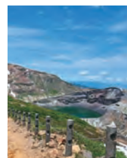
宮城県荊田郡蔵王町の火口湖 2022年7月撮影