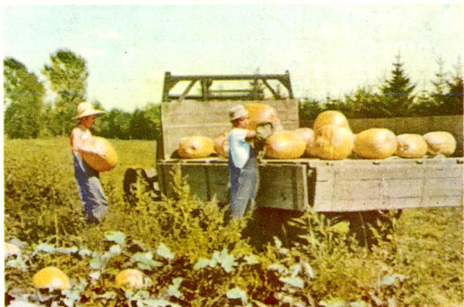
家畜南瓜(ボンキン)の収穫(上野幌育種場)