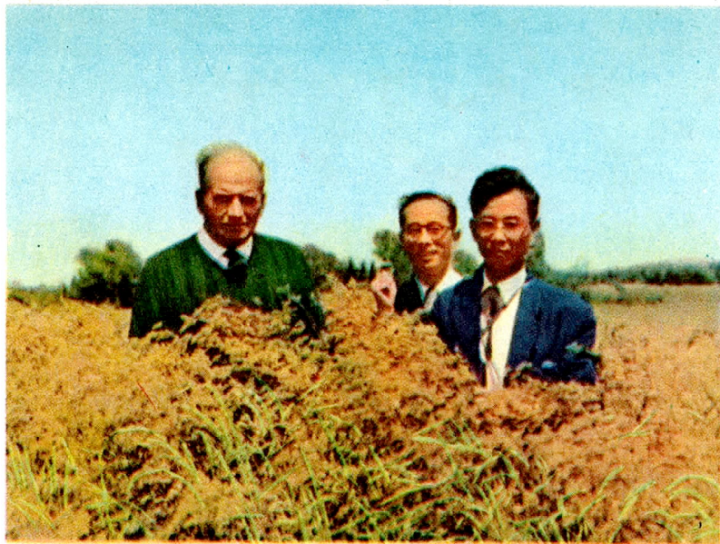
雪印オーチャード採種圃におけるホワイト博士