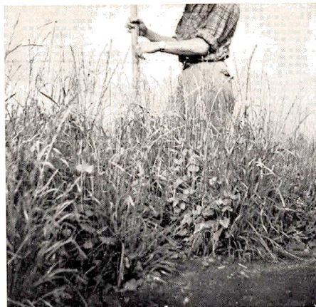
①イタリアンライグラス（クリムソン混播）

融雪早々播種2カ月で3,200 疋 分蘖多く、葉の多い草質の軟かい雪印101号 をお試し下さい。