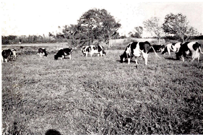
いね科、まめ科牧草で造成された 理想的な放牧牧草地