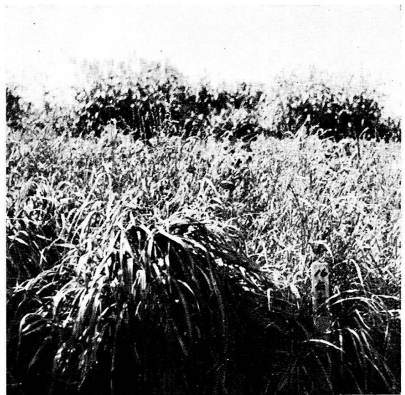
写真 左側マンモス・イタリアン 右側在来種