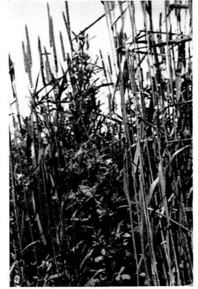
チモシー (クライマックス)