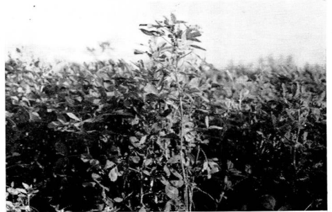
ルーサン (デュピー)