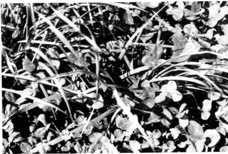
白クロバー (ニュージーランドホワイト)