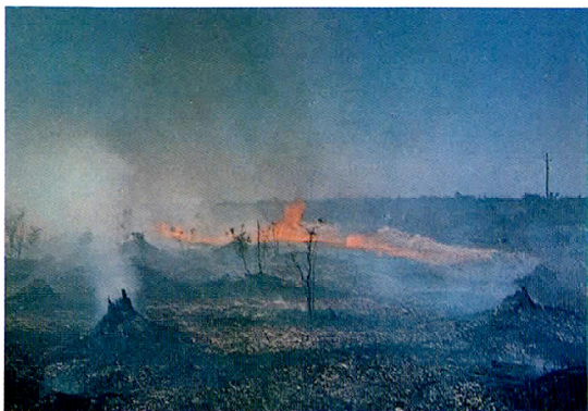
② 火入れの状況（猿払の牧野）