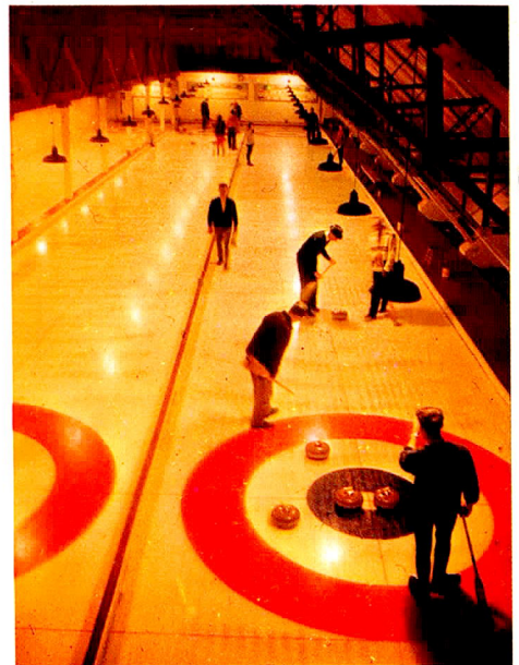
⑤氷上のゲーム「カーリング」