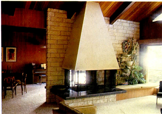
②フアィアー・プレイス（暖炉）