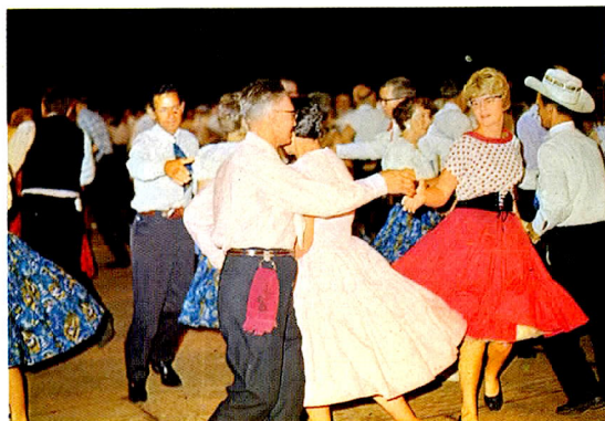
③ スクウェア・ダンスの夕