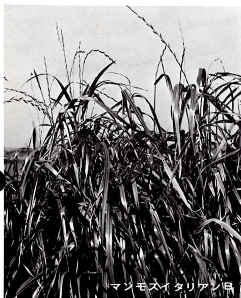
マンモスイタリアンB