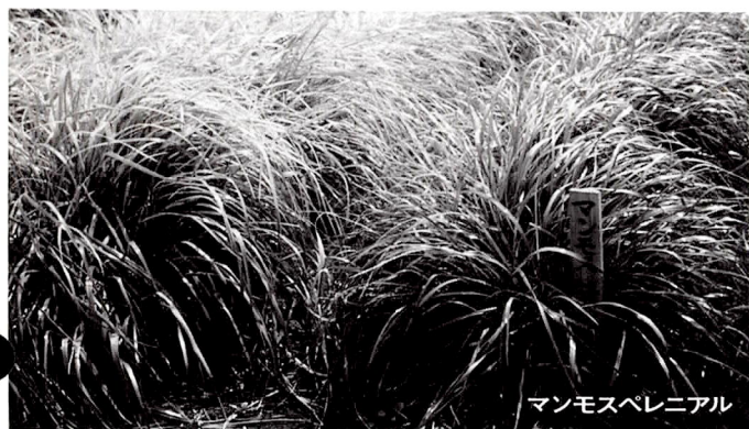
マンモスペレニアル