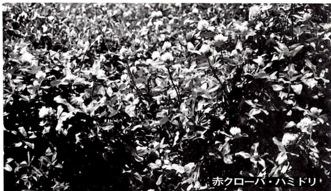
赤クローバ・ハミドリ