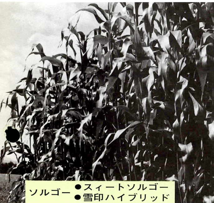
ソルゴー ● スイートソルゴー ● 雪印ハイブリッド