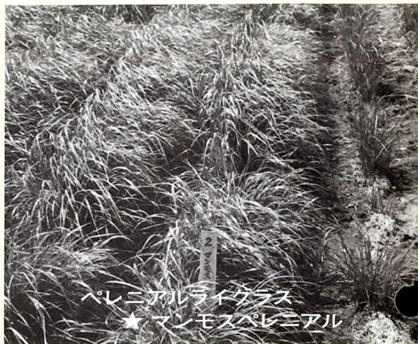
ペレニアルライグラス ★マンモスペレニアル