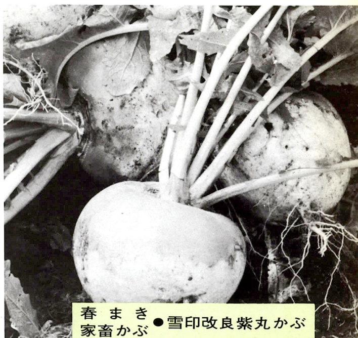
春まき ● 雪印改良紫丸かぶ 家畜かぶ