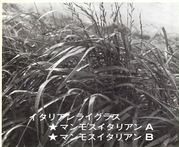
イタリアライグラス ★マンモスイタリアン A ★マンモスイタリアン B