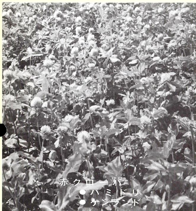
赤クローバー ● ハミドリ ● ケンランド