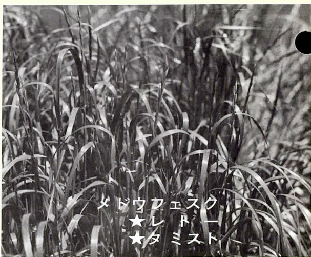
メドウフェスク ★レトロー ★タミスト