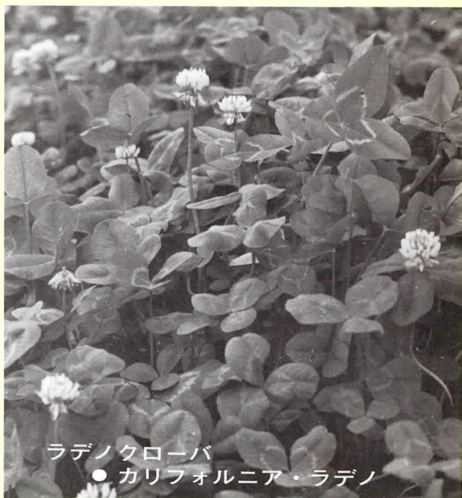
ラデノクローバー ● カリフォルニア・ラデノ