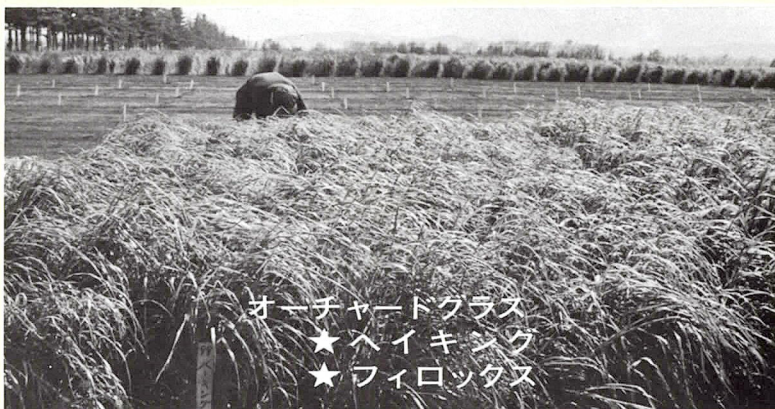
オーチャードグラス ★ハイキング ★フィロクヌ