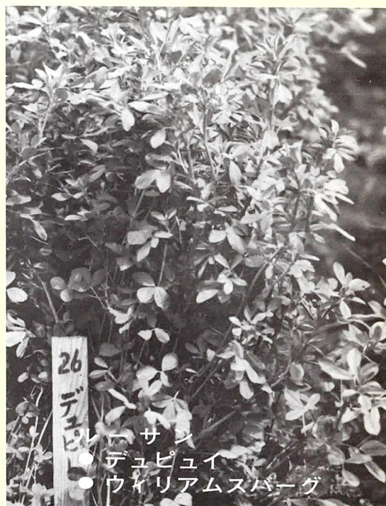
サン デュピュイ ● ウィリアムスバーグ