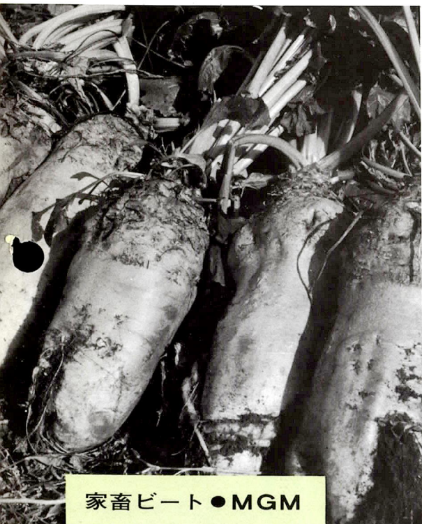
家畜ビート ● MGM