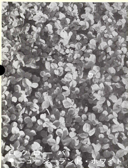
白クローバー ● ニューゼーランド・ホワイト