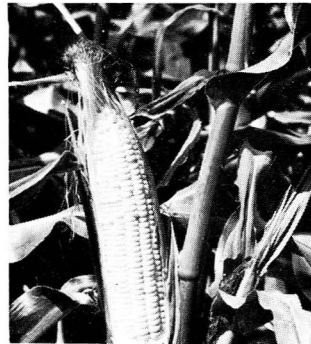
アーリー・スーパー・スイート