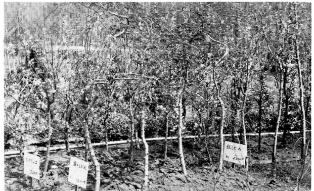
花木類植込場の一部