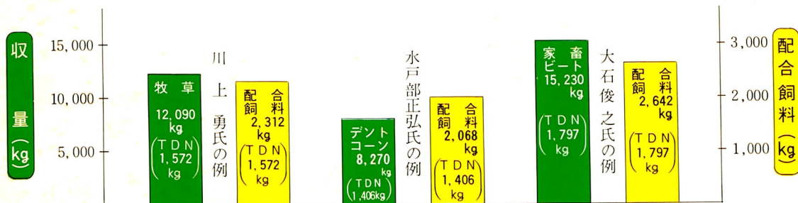
上記自給飼料の栄養価を配合飼料と対比すると