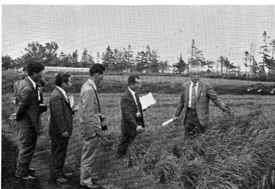
オーチャードグラスの早・晩性系統の検討