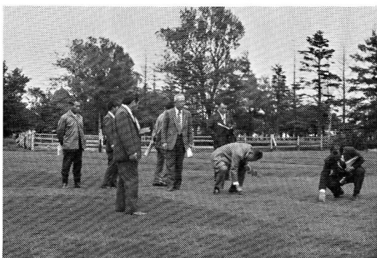
雪印種苗、札幌研究農場芝生試験圃にて