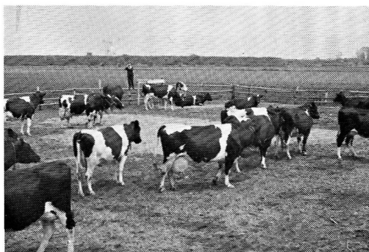
よい土(土地改良)、よい草、よい牛を地で行く棚橋牧場の乳牛群 (群平均で 6,000kg以上の搾乳)