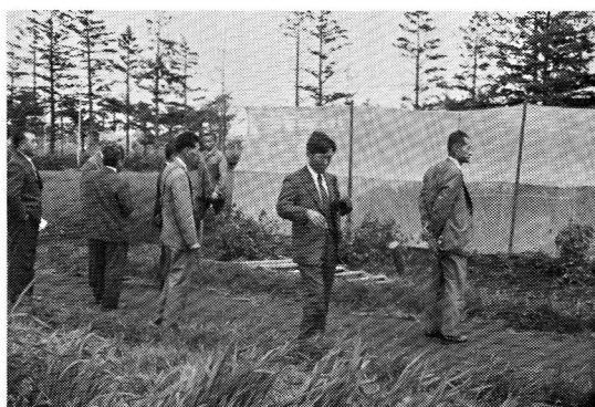
アカクローバ、ハミドリ4倍体の育種家種子採種のポリネーションケージ