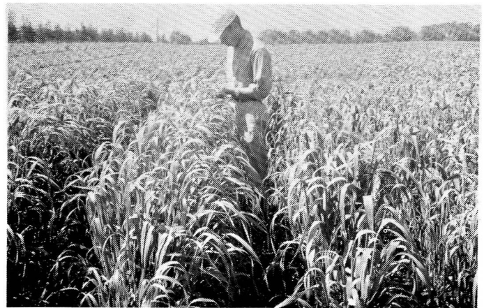
分けつ多く再生のよい雪印101号