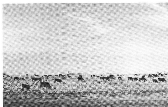
収穫後の肉牛の放牧