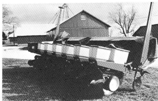
6 畦用コーンプランター