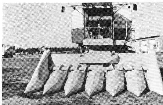
6 畦用トウモロコシコンバイン