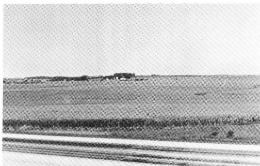
一面のトウモロコシ畑