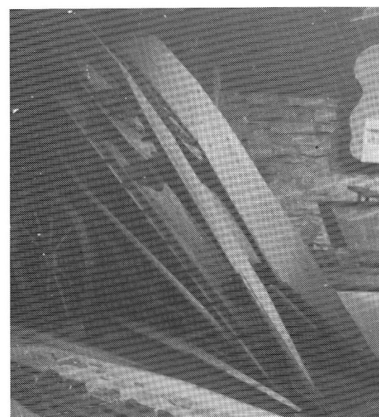
最も古い型の木製コーンピッカー (馬車で引く、1850年頃のもの)