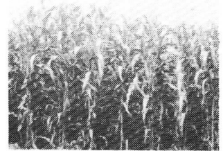
スノーデント2号（右） スノーデント3号（左）

草丈（稈長）はやや低く、茎は太く、雌穂が大きく穀実収量が多い。着穂位置が低く、根張りがよく倒伏に強い。東北地方から九州まで全国的に好評。