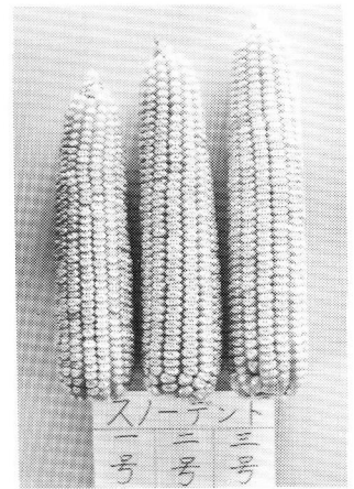
スノーデント1号, 2号, 3号 黄熟期の雌穂