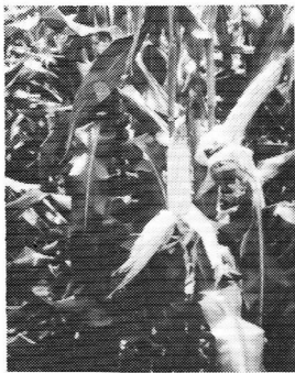
好評のパイオニア1号