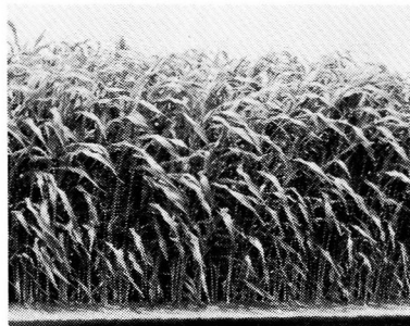
スイートソルゴー

倒伏に強く、穀実が多く、高カロリーのサイレージに適する。乾燥地、堆肥、多肥が必要。