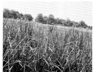
雪印系シコクビエ