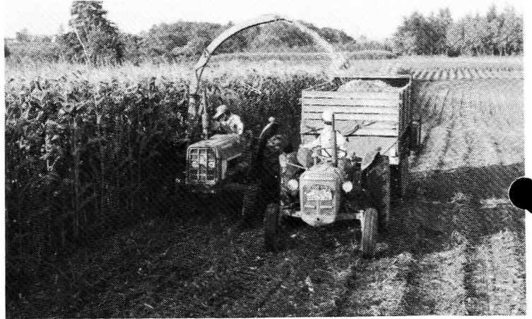
フォーレージハーベスターによる収穫