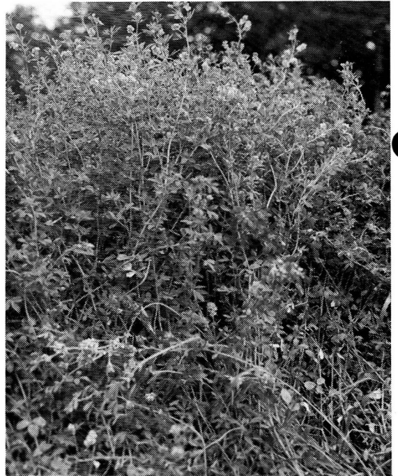
(牧草の女王アルファルファ)