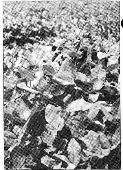
春の生育が早いアローリーフクローバ