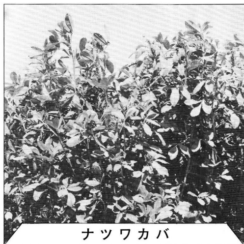
早生。初期生育，再生良好。暖地の永続性良。 関東，西南暖地に最適。