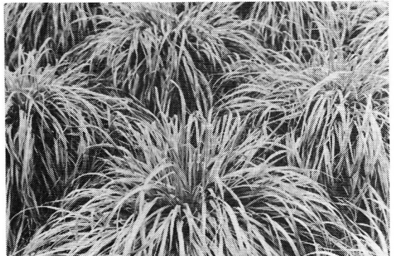
初期生育旺盛で、越夏性に優れる「エース」 (個体調査圃場)

極 短 期----- 3月下旬~4月中旬ころまで 短 期----- 5月下旬ころまで 中 期----- 6月中旬ころまで 長 期----- 7月上旬ころまで 極 長 期----- 翌年の秋以降, 2~3年