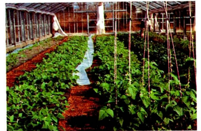
サイトウ育種試験