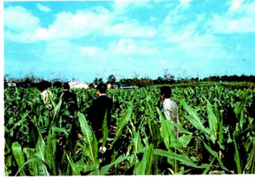
トウモロコシ耐病性検定圃場