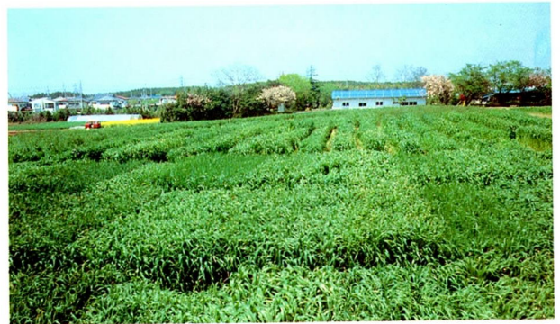
春の圃場風景(ムギ類・イタリアンライグラス等が中心)