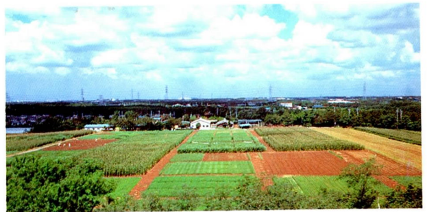
夏の圃場風景(トウモロコシ・ソルガム・青刈類が中心)