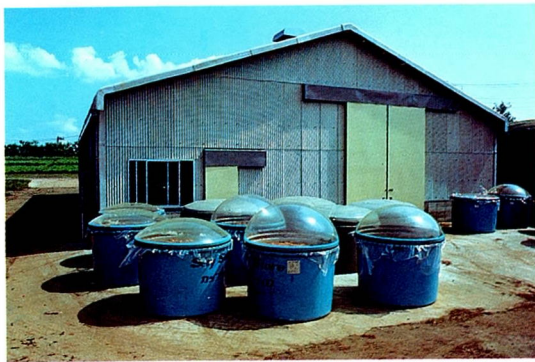
サイレージ発酵品質に関する試験