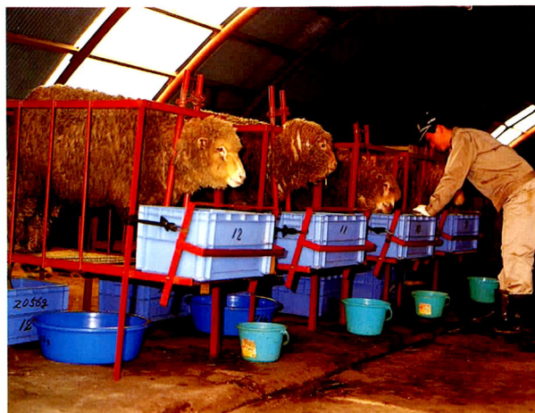
▲ 各種飼料の消化試験は綿羊(反芻獣)を用い厳密に行う