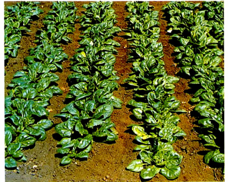
▲ ホウレンソウの品種(系統)比較試験