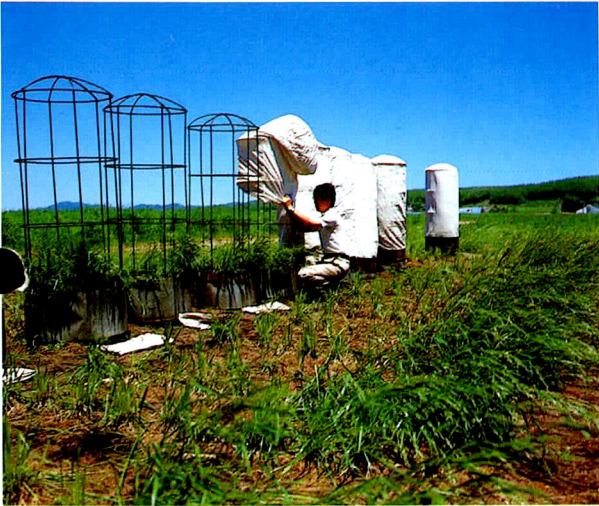
▲ 牧草の優良品種育成