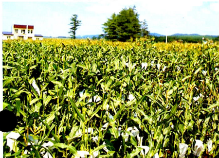
▼ F1トウモロコシの優良品種育成(インブレッダライン)