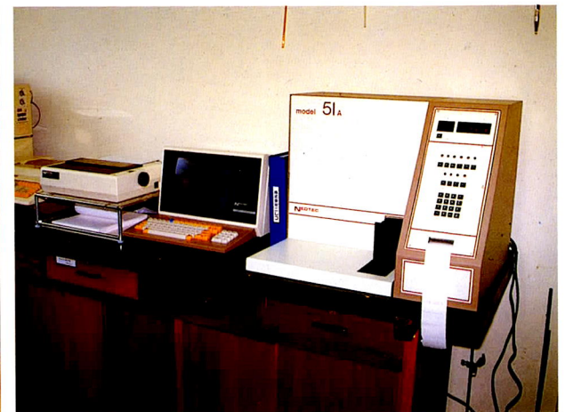
▲ 酪農家から依頼される粗飼料分析は近赤外分析装置を用いる