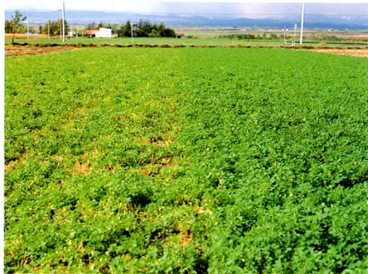
左：市販種 右：抵抗性品種『パータス』