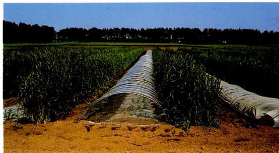
スイカの防風栽培・ライムギ「初春」