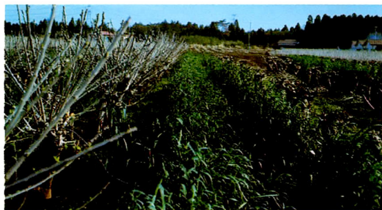
桑園間作栽培・ライムギ「初春」