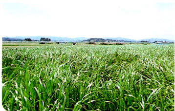
イタリアンライグラス4倍体「マンモスB」