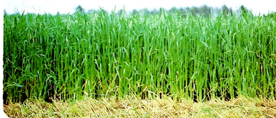
直立型、耐倒伏性エンバク「とちゆたか」