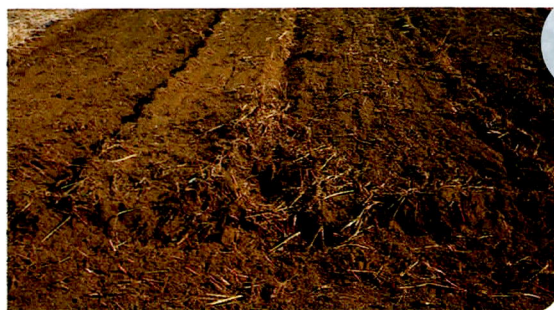
すき込み後の活力ある土壌