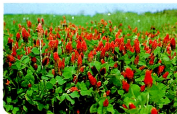
クリムソクローバ