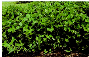
アルサイククローバ