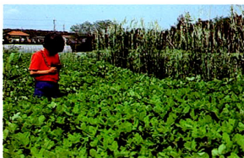
アローリーフクローバ