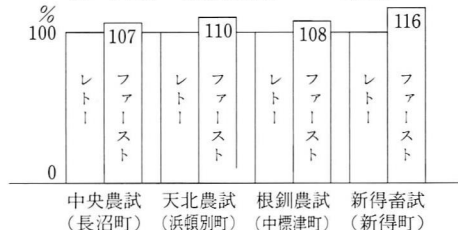
ファーストの多収性 (3か年合計の乾物収量比「レトー対比」)