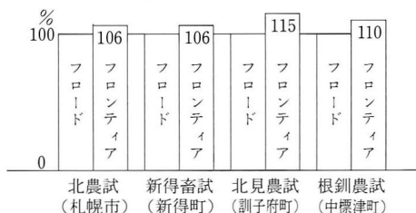
フロンティアの多収性 (3か年合計乾物収量比)