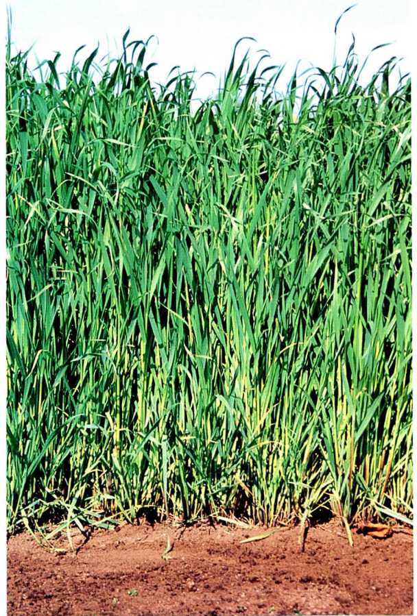
緑肥用エンバク ハイオーツ