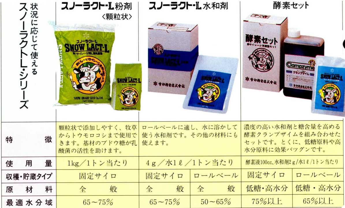
酵素セット*添加サイレージの発酵品質