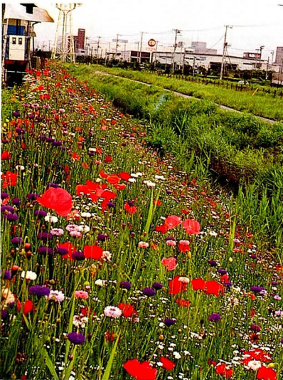
ポピュラータイプの開花（千葉県）