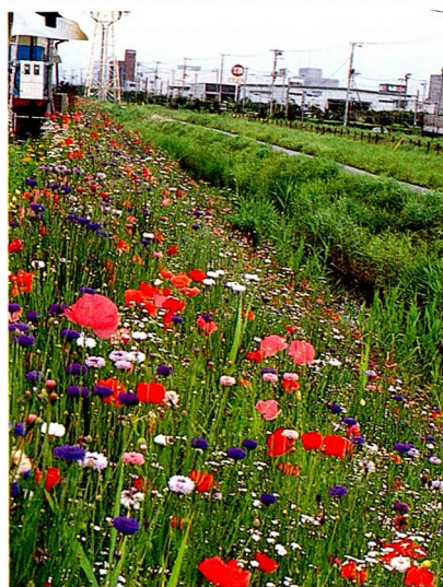
ポピュラータイプの開花（千葉県）