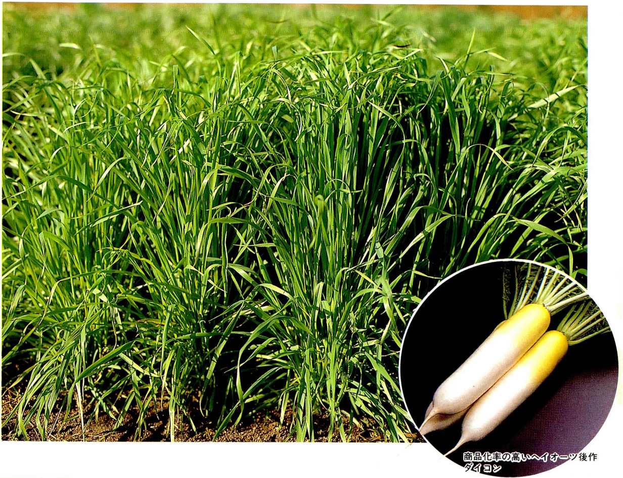
商品化率の高いハイオーツ後作ダイコン