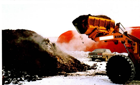
《スノーエックスによる堆肥の発酵促進》

ハウス牛舎から排出した敷料を野積みになっている肉牛生産者。厳寒期(12月)の北海道十勝地区で、堆肥場には屋根がなく雪が積もっていても堆肥発酵は順調である。スノーエックスを使用して、堆肥の切り返しが少なくなり、大幅な労力節減が可能になった。また、排出敷料と熟成堆肥とを層状に積むなどして、完熟堆肥の促成に効果を上げている。