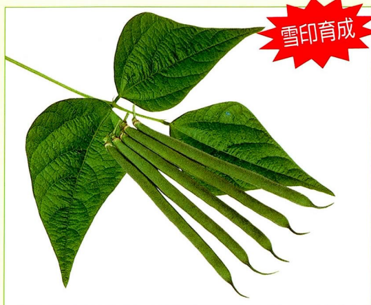
スノークロップ・さやかざり