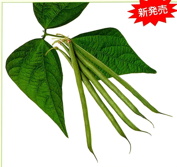
ベストクロップ・キセラ