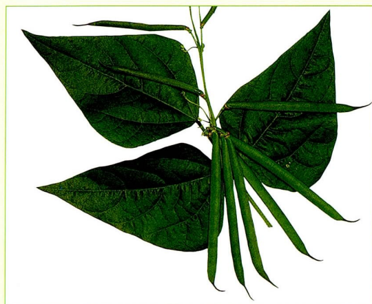
スノークロップ・ネリナ