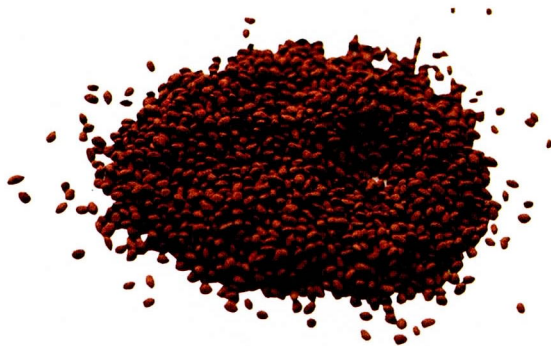
ハイパーコート種子