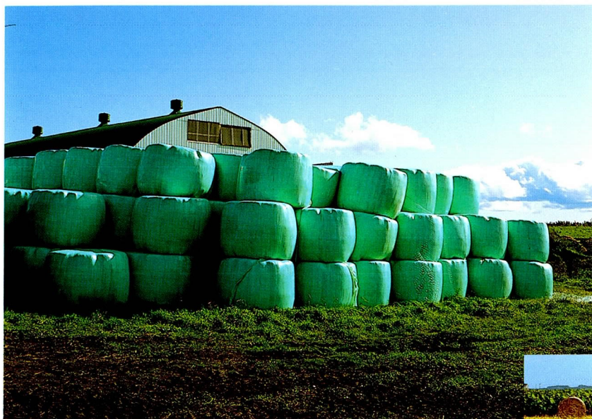
今、話題の緑のフィルム