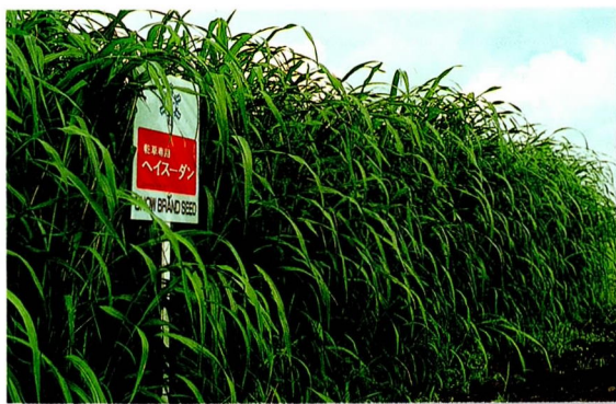
ヘイスーダン （早生）