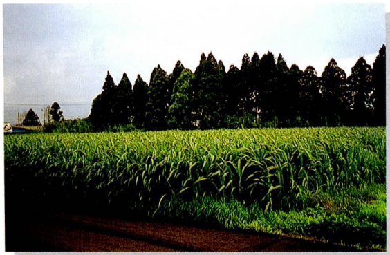
ウルトラソルゴ （極晩生）