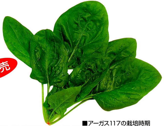
■アーガス117の栽培時期