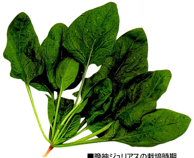
■晩抽ジュリアスの栽培時期