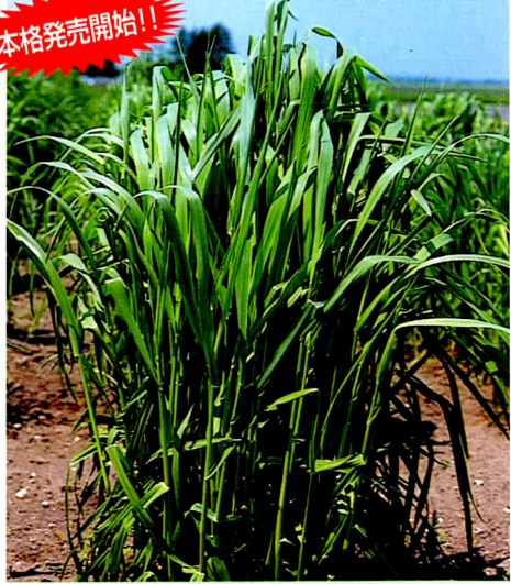
チモシー ホクエイ 北海道優良品種 農林水産省登録品種