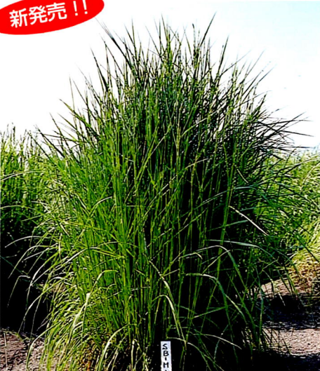
メドウフェスク リグ 北海道優良品種