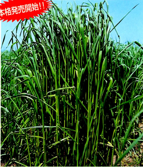
チモシー ホクセイ 北海道優良品種 農林水産省登録品種