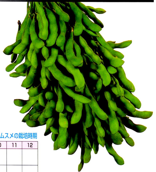
■サヤムスメの栽培時期