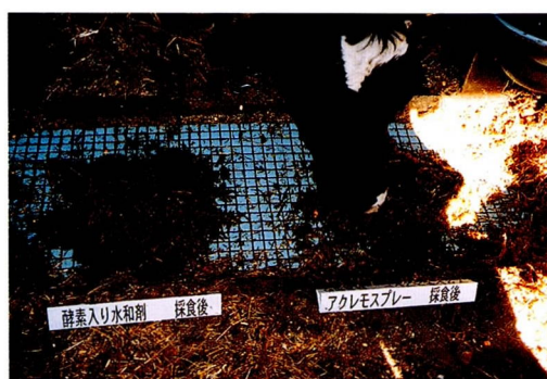
写真2 「アクレモ」添加サイレージ好食(採食後)