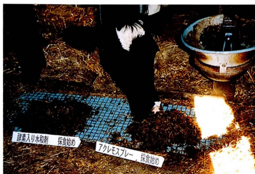
写真1 「アクレモ」添加サイレージ好食(採食始め)