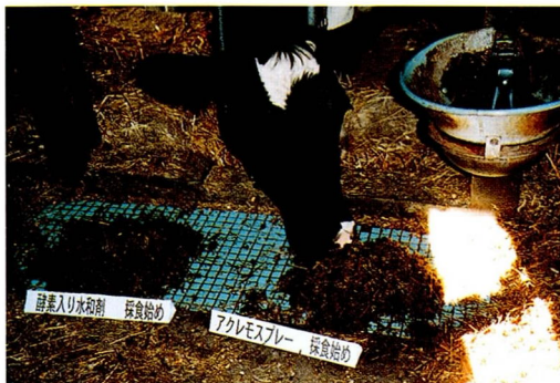
写真1 「アクレモ」添加サイレージ好食 (採食始め)