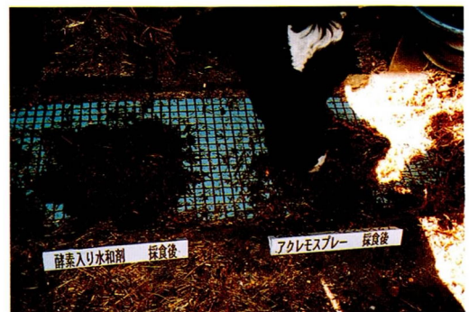
写真2 「アクレモ」添加サイレージ好食 (採食後)