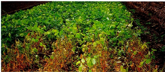
写真：手前がアズキ連作区、奥がハイオーツ栽培区