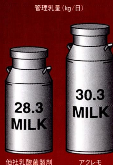
アクレモ添加サイレージの給与により経済効果も期待できる! アクレモ添加サイレージに切り替える前後の乳量

※管理乳量: 2産次・検定日数150日・4月分娩を基準としてのSCM乳量補正の平均搾乳牛約30頭の平均