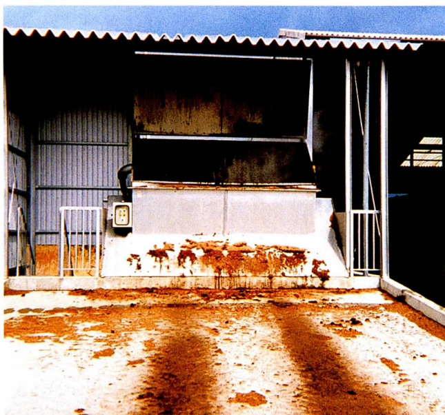
沃野16A キルン径3.0×長さ16m 実行処理容量79m 3 /7日