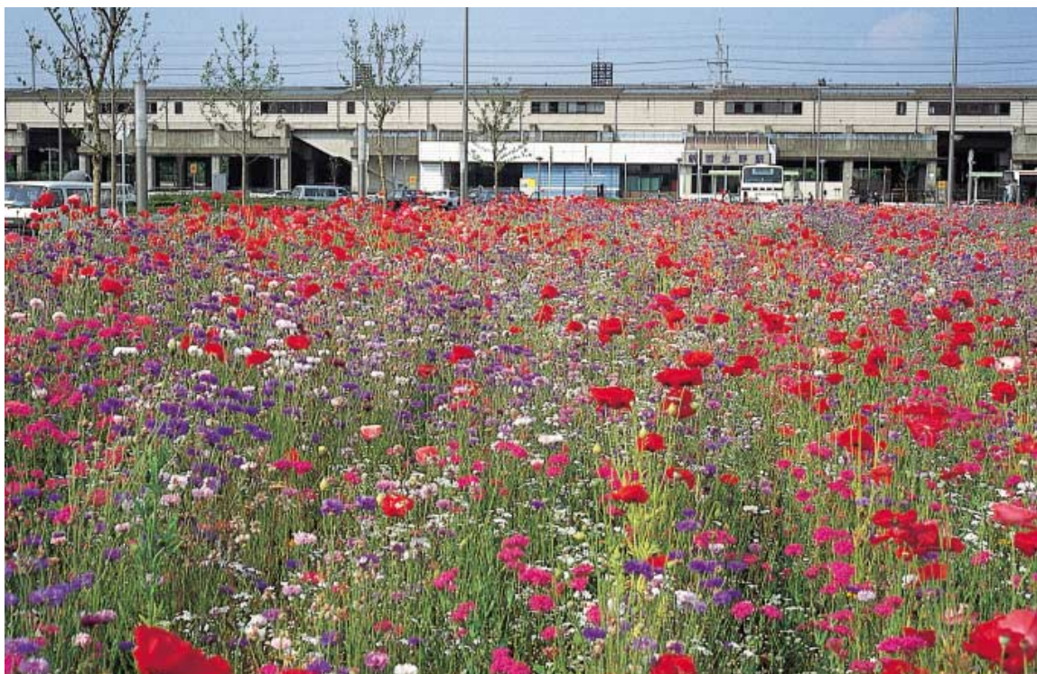
(写真 ポピュラータイプ)