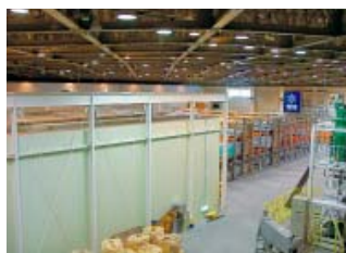
種子センター内部